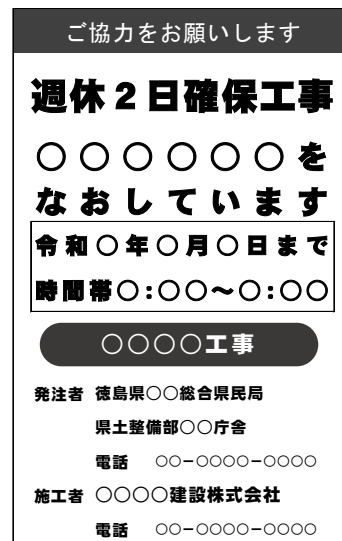
（標示板記載例）月単位の場合